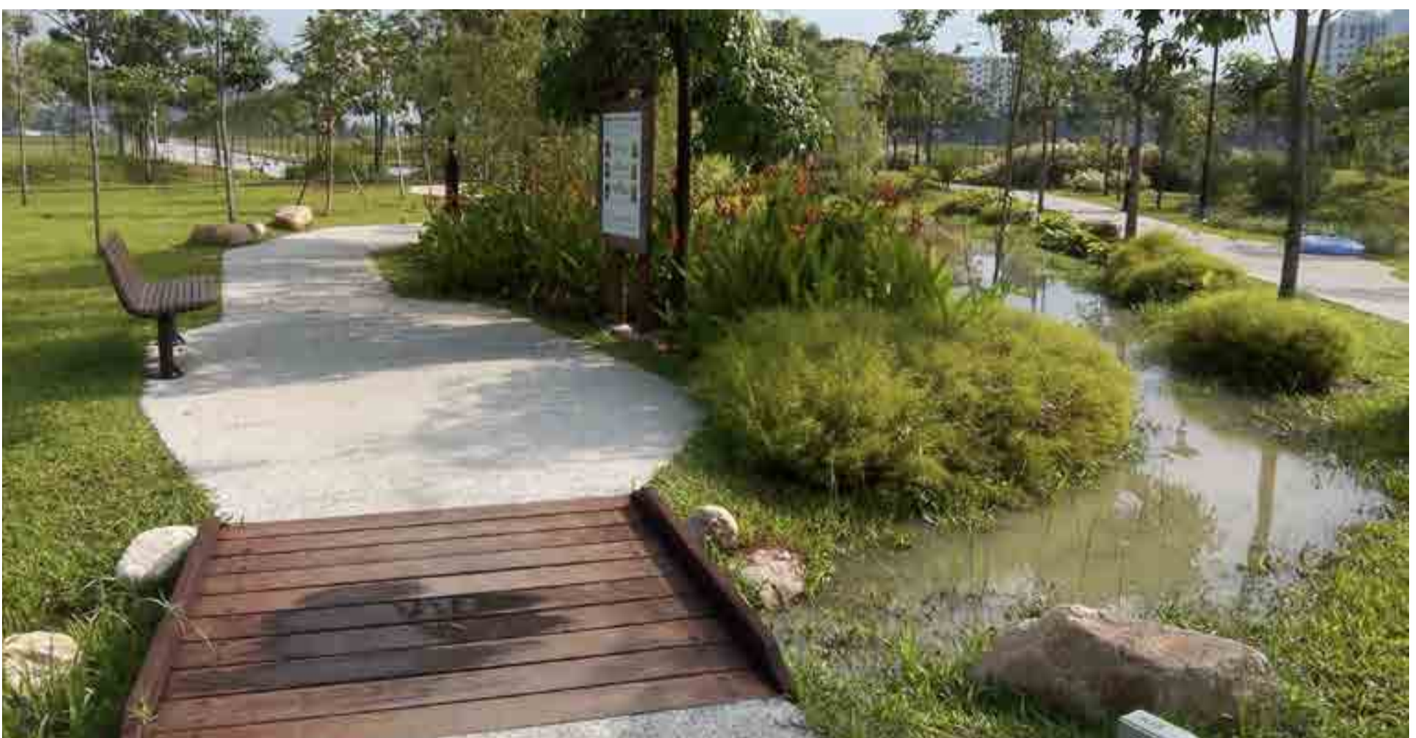
ABC Waters design features