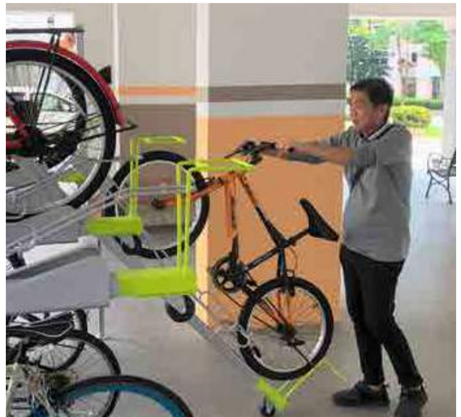
Bicycle stands to encourage cycling